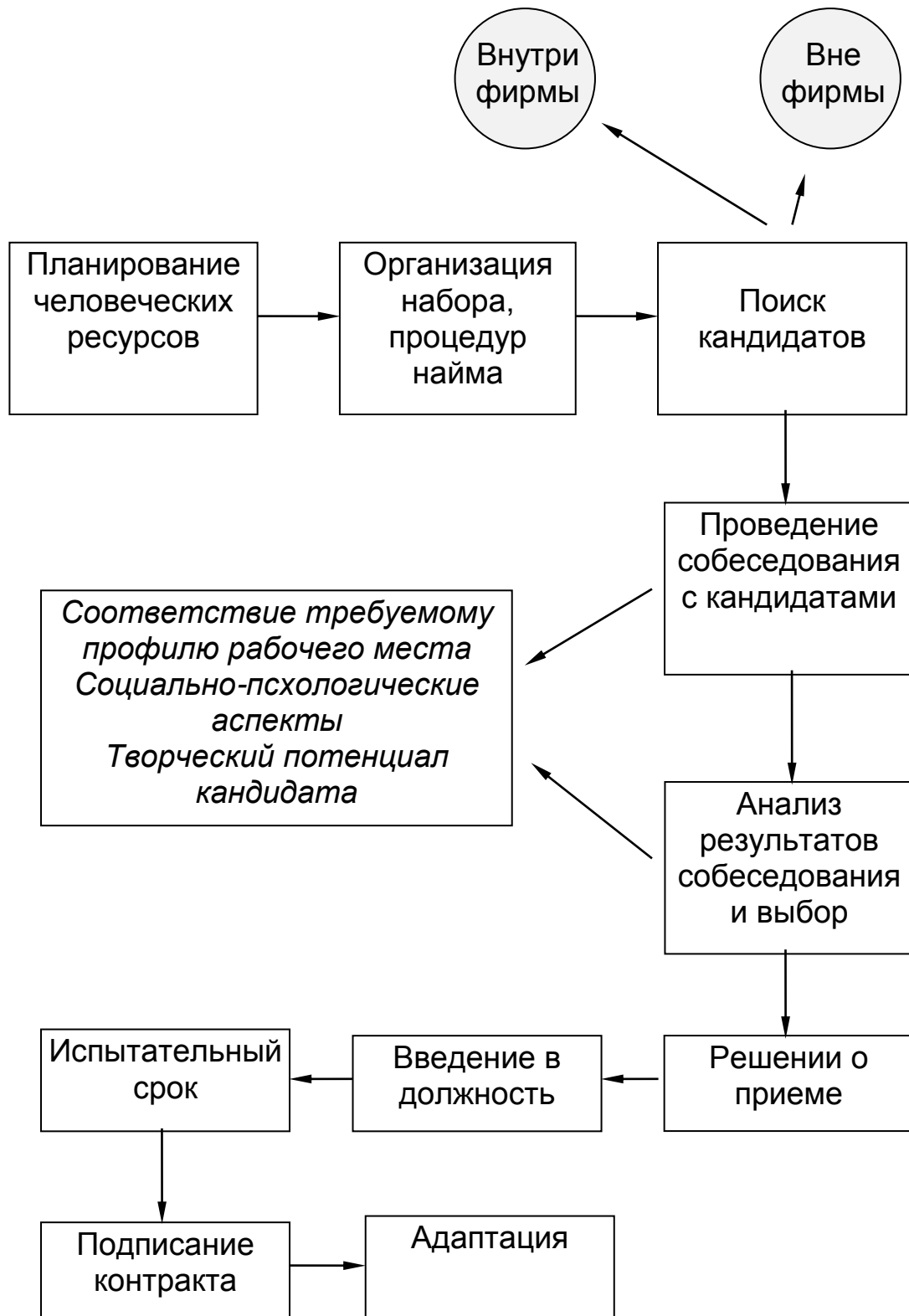
Схема организации найма